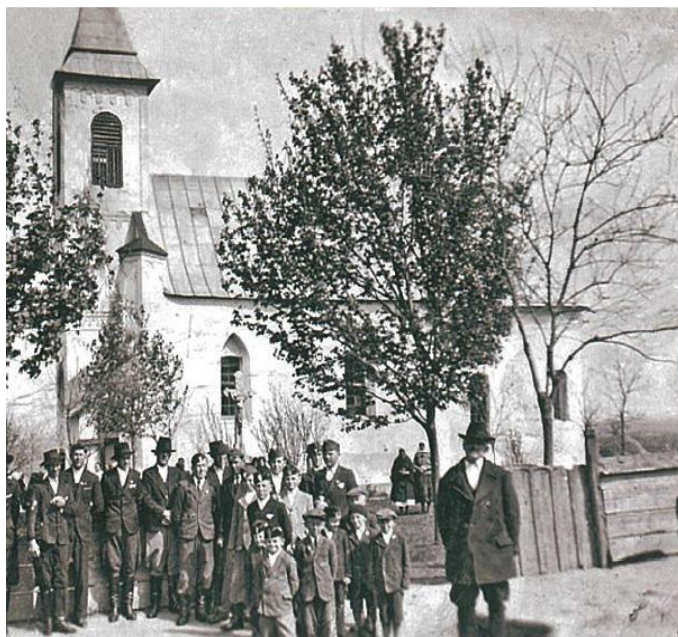
Rímskokatolícky kostol v Chyme okolo roku 1941

Rímskokatolícky kostol sv. Štefana v Chyme - jednolod'ová gotická stavba so segmentovým ukončením presbytéria a predstavanou vežou z konca 13. storočia.