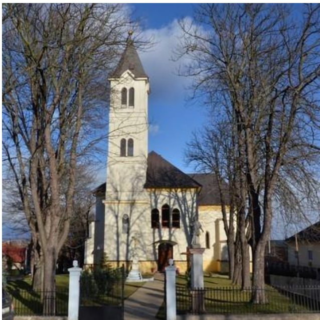
Rímskokatolícky kostol v Períne