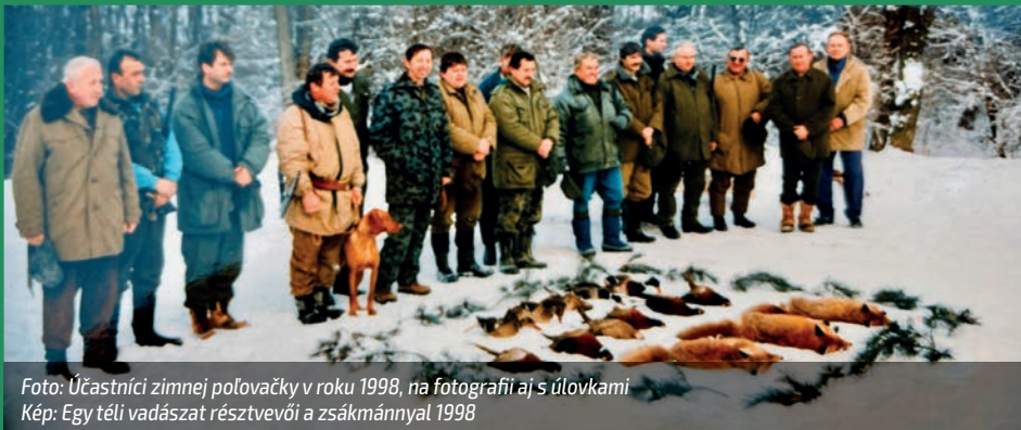
Foto: Űčastníci zimnej poľovačky v roku 1998, na fotografii aj s úlovkami Kép: Egy téli vadászat résztvevői a zsákmánnyal 1998

Az emberiség történelmében a vadászat már az őskorban is jelen volt, főként a táplálékszerzés céljából. Az első vadásztársulatokról szóló feljegyzések területünkön a 18. és 19. századig vezethetőek vissza. A vadászat fő célja az idő múlásával folyamatosan változott. Napjainkban főképpen természetvédelmi, gazdasági céljai vannak és egyben hobbitevékenység is. A vadászaink igyekeznek az erdeinkben élő állatok számára egy élhető környezetet teremteni, a téli ínséges időkben biztosítani a vadak táplálékát a kiépített etetőekben. Ezt tekinti fő céljának a Diana vadásztársulat is amely ezen az éven ünnepli