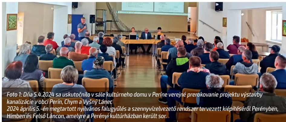
Foto 1: Dňa 5.4.2024 sa uskutočnilo v sále kultúrneho domu v Períne verejné prerokovanie projektu výstavby kanalizácie v obci Perín, Chym a Vyšný Lánec 2024. április 5.-én megtartott nyilvános falugyűlés a szennyvízelvezető rendszer tervezett kiépítéséről Perényben, Hímben és Felső Lánccon, amelyre a Perényi kultúrházban került sor.

Autor: Ing. Gabriel Vinter