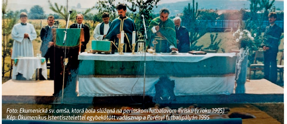
Foto: Ekumenická sv. omša, ktorá bola slúžená na perínskom futbalovom ihrisku (v roku 1995) Kép: Ókumenikus Istentisztelettel egybekötött vadásznap a Perényi futballpályán 1995

Činnosť poľovníkov nielen v našich revíroch, ale aj pri podpore a organizácii spoločenských podujatí funguje v našej obci už dlhé roky. Mnohí