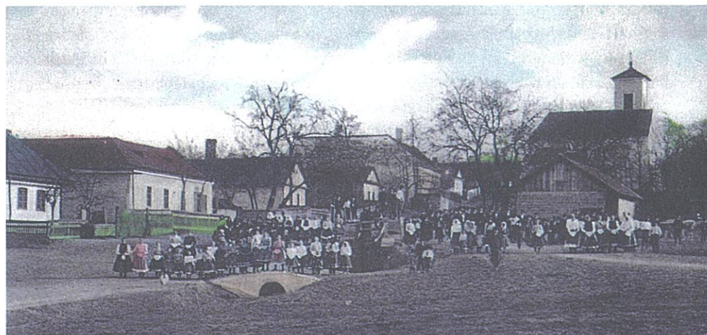
Centrum Perína v druhej polovici 19. storočia / Perényi közpöntjának látképe a 19. század második felében.